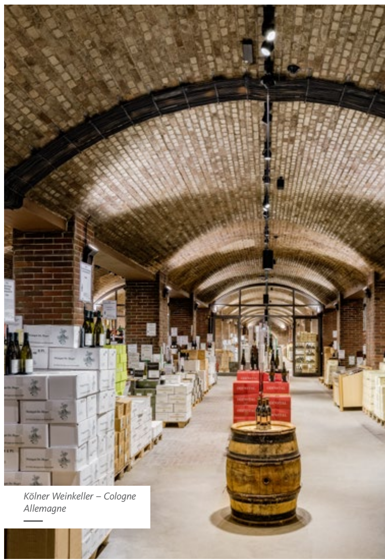
Kölner Weinkeller – Cologne Allemagne