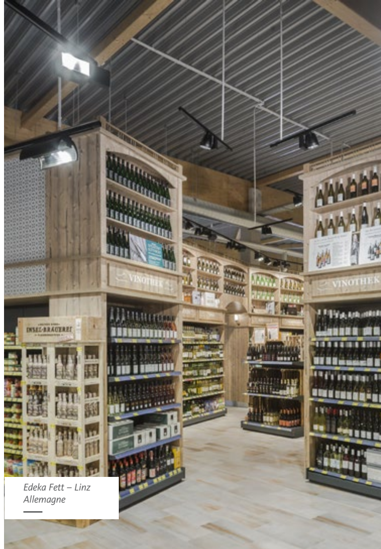
Edeka Fett – Linz Allemagne