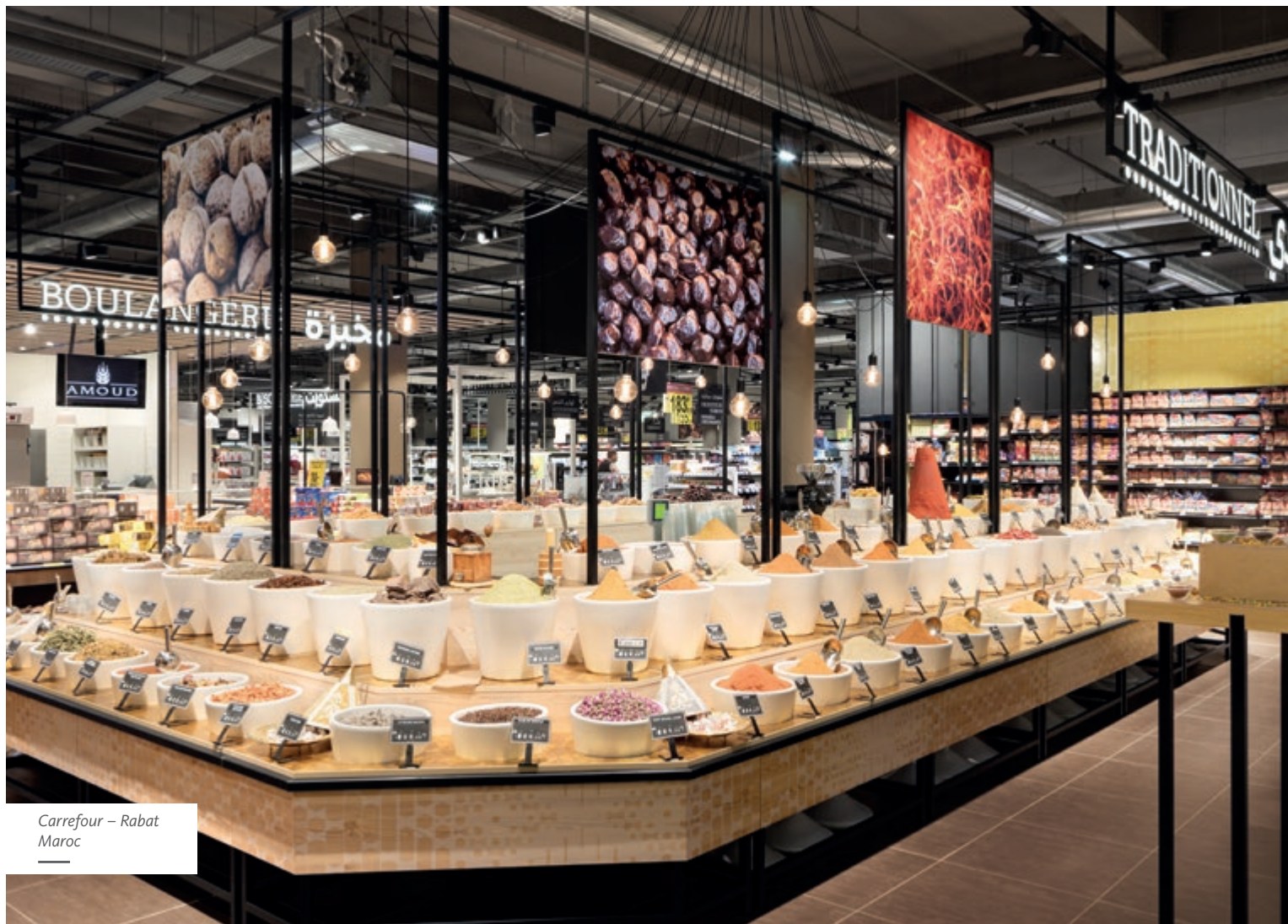
Carrefour – Rabat Maroc