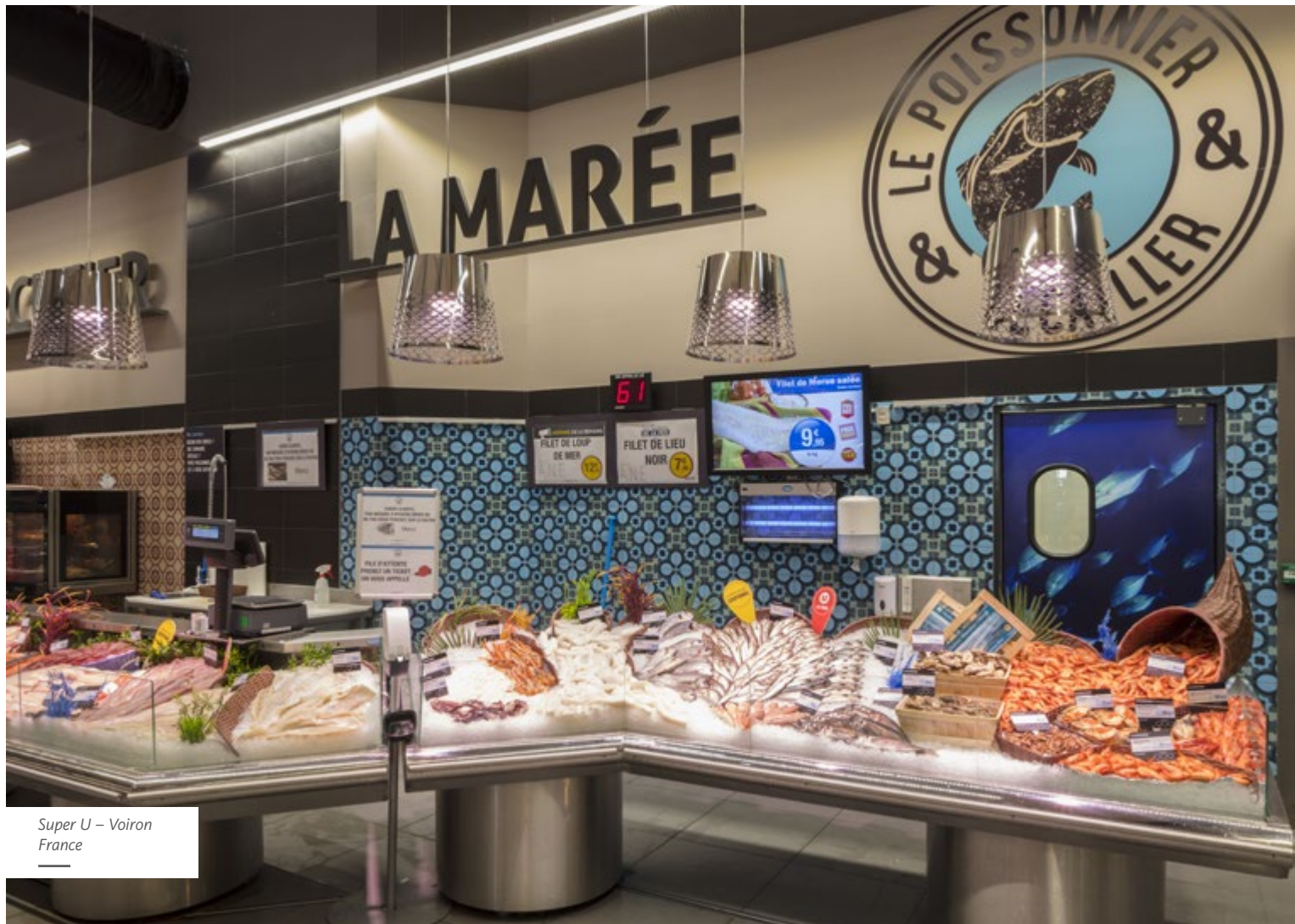
Super U – Voiron France