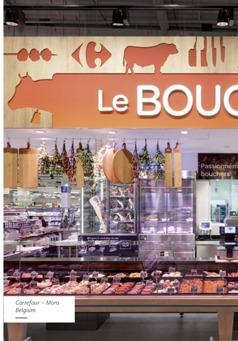
Carrefour – Mons Belgium