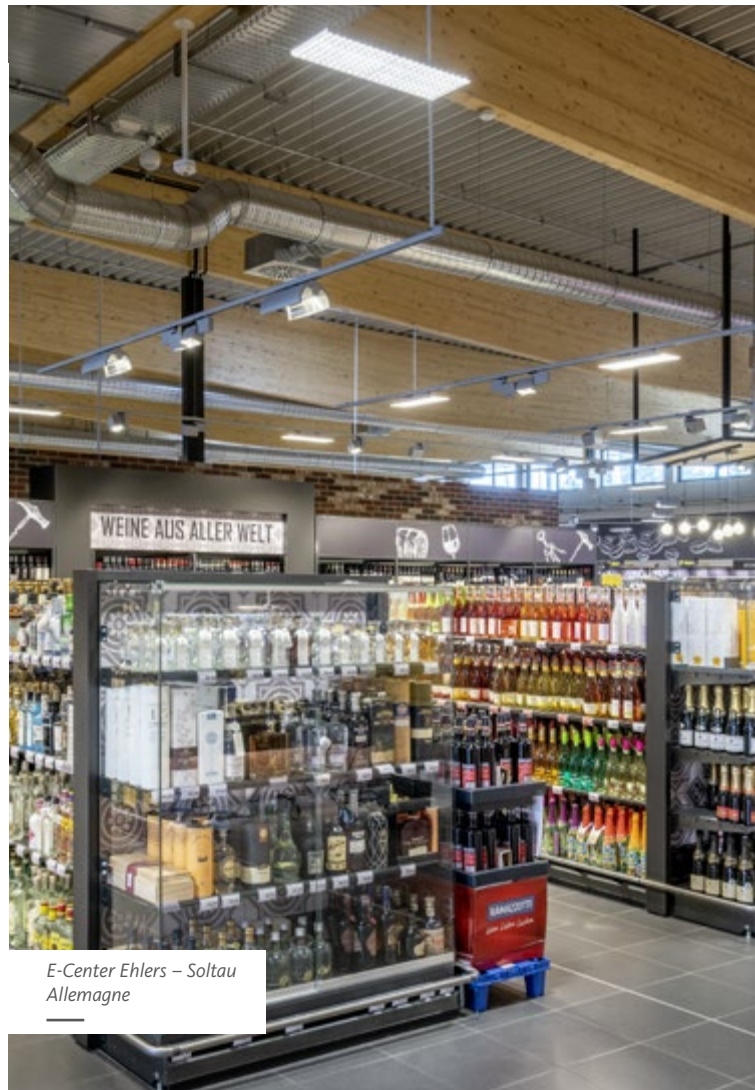
E-Center Ehlers – Soltau Allemagne