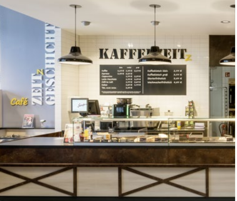
Edeka Rothe – Zeit Allemagne