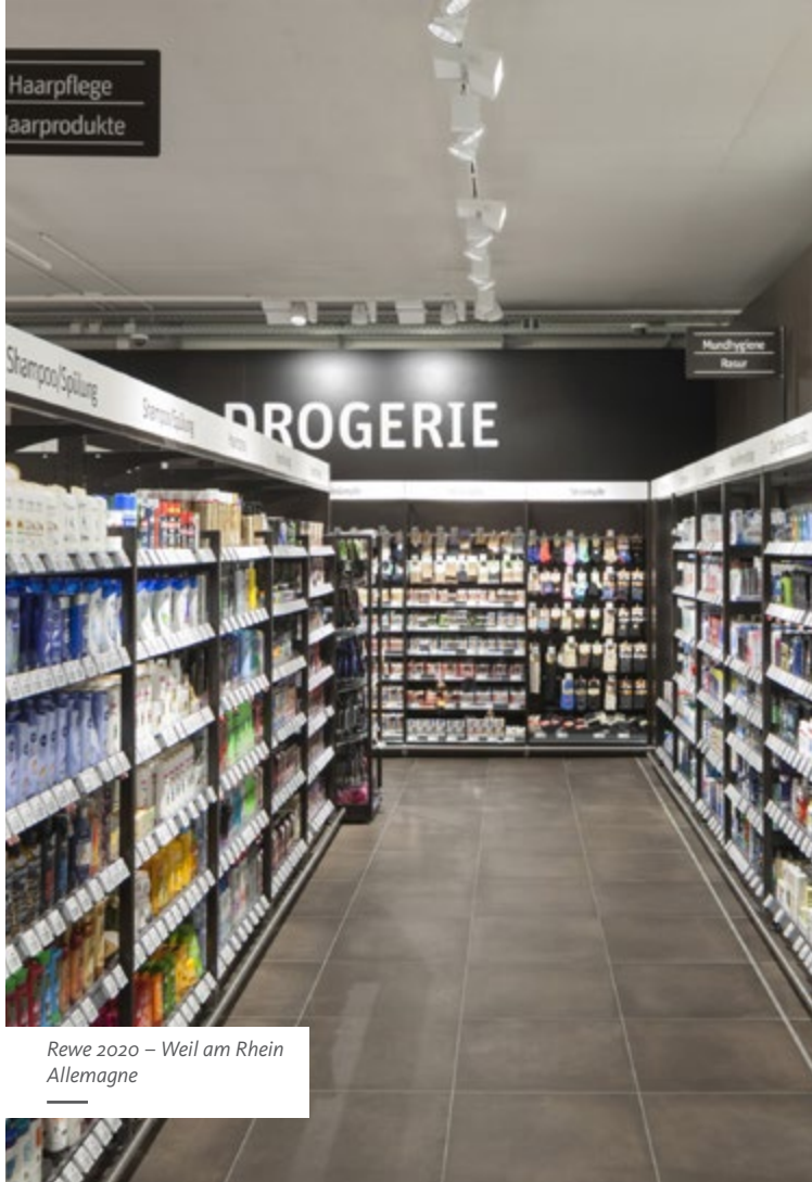
Rewe 2020 – Weil am Rhein Allemagne