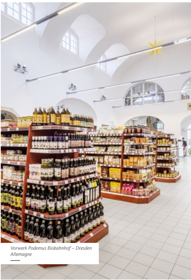
Vorwerk Podemus Biobahnhof – Dresden Allemagne