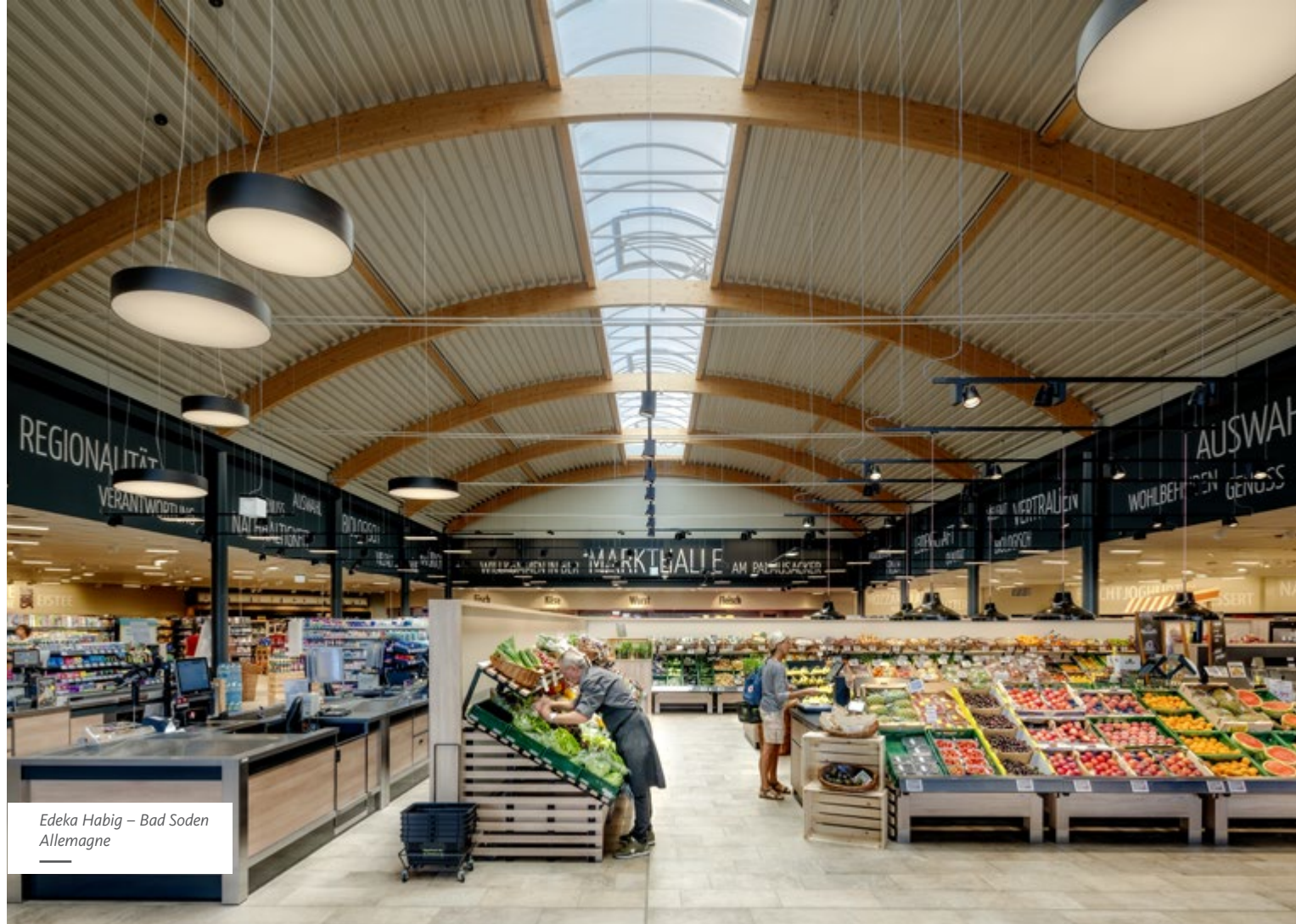
Edeka Habig – Bad Soden Allemagne