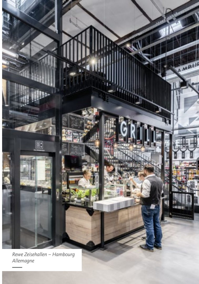
Rewe Zeisshallen – Hambourg Allemagne