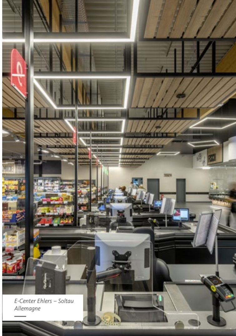
E-Center Ehlers – Soltau Allemagne