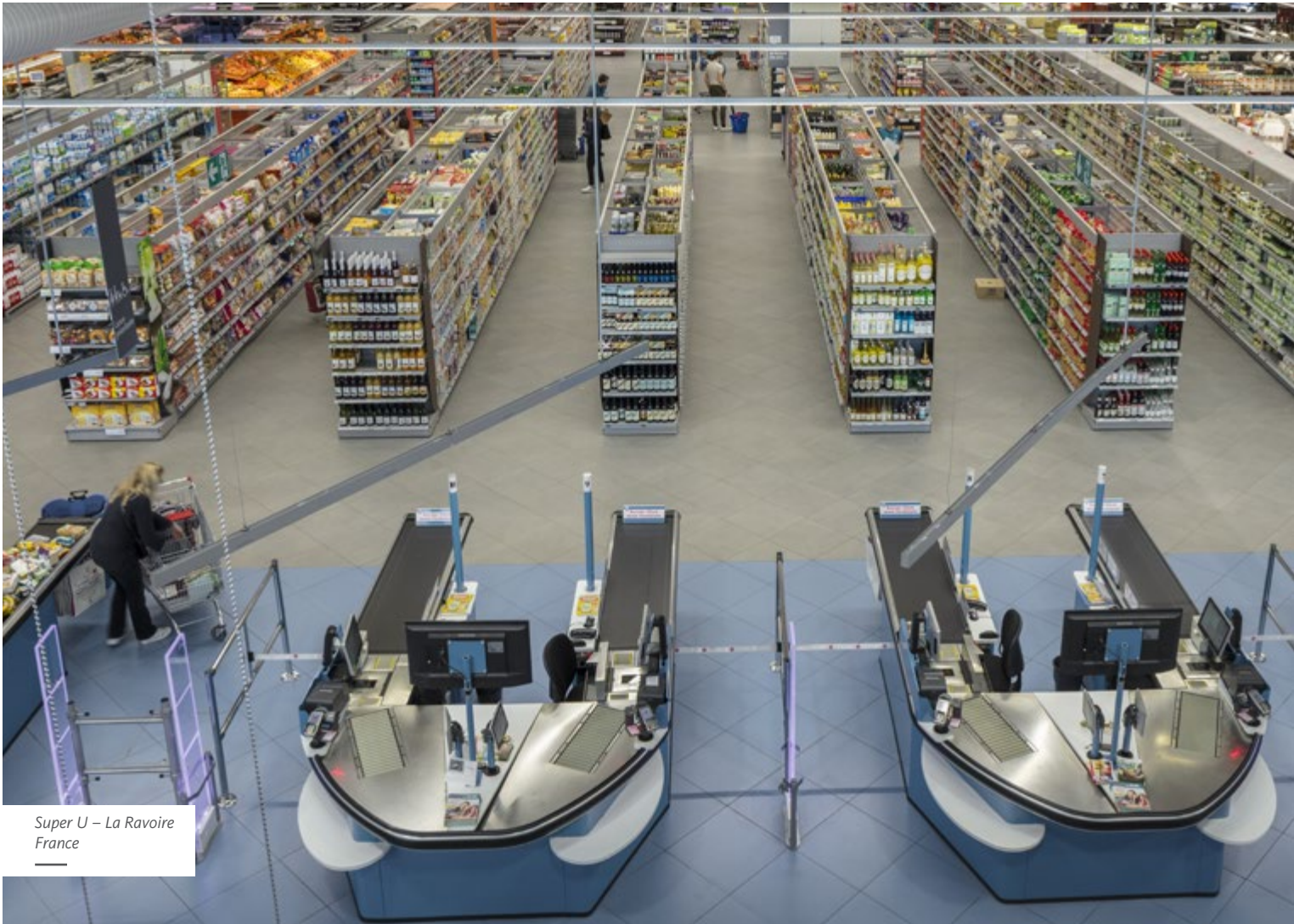
Super U – La Ravoire France