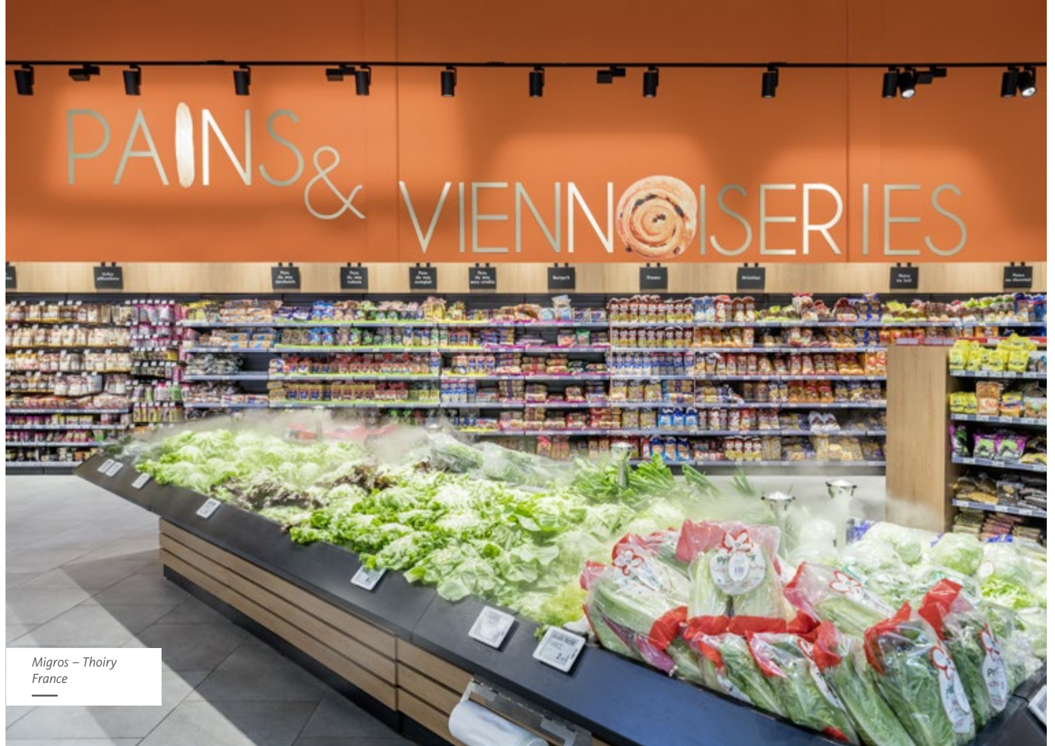
Migros – Thoiry France