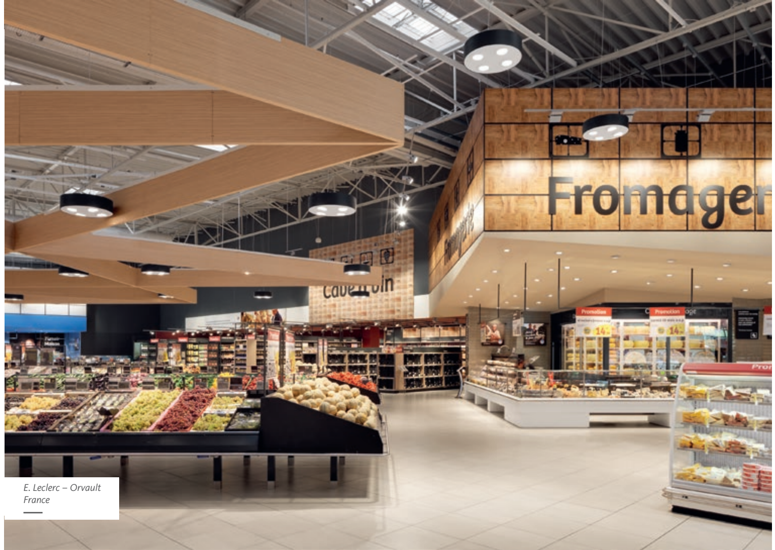
E. Leclerc – Orvault France